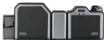
вухсторонний принтер/кодировщик с модулем для ламинирования